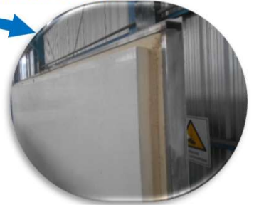
AISLACION PUR de 80 mm a 100 mm