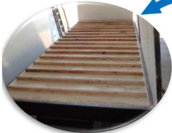
PISOS reforzados con tablas de Saligna estacionada y FENOLICO