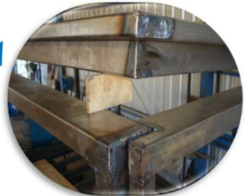
VINCULANDO y reforzando el CABEZAL Trasero y Delantero, el techo, pecho y la culata