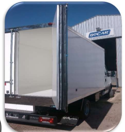
PUERTAS y TRONERAS con Burletes "Doble Labio"

OPCIONES diversas para " PISOS " PLASTIFICADOS con fibra de vidrio y gel-coat ACERO INOXIDABLE - calidades ..: AISI 304 y AISI 430 ( Lisos o Acanalados ) Acanalados de ALUMINIO