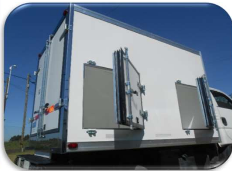
Vista de PUERTAS y TRONERAS