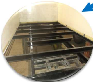
UNIONES estructurales entre la base del chasis y las perfilería de los paneles perimetrales