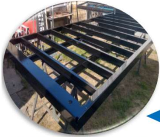
BASES Metálicas, con perímetro de chapas estampadas y teleras de I.P.N

unidades térmicas construidas con paneles de P.R.F.V, reforzadas con estructuras metálicas en su interior