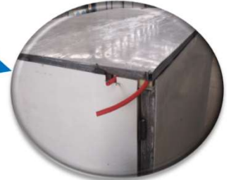
VINCULANDO y reforzando el CABEZAL Trasero y Delantero, el techo , pecho y la culata