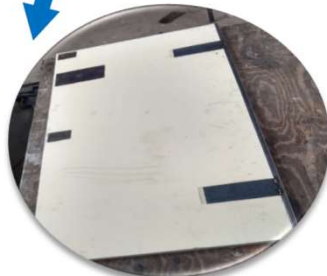
MARCOS y PUERTAS fabricadas con perfilería y placas de anclaje interno