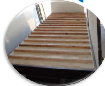
PISOS reforzados con tablas de Saligna estacionada y FENOLICO