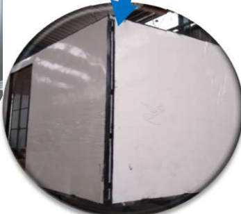
UNIONES estructurales entre la base del chasis y las perfilierías de los paneles perimetrales