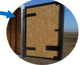
MARCOS y PUERTAS fabricadas con perfiliería y placas de anclaje interno