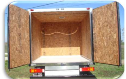
O.S.B ( CON BUCHE )