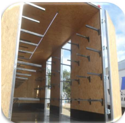
* con ESTANTERIAS