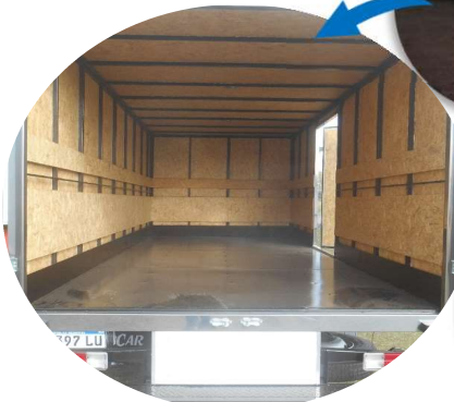
OPCIONES diversas para " PISOS " Chapa 1/8" - LISA o ANTIDESLIZANTES PLASTIFICADOS con fibra de vidrio y gel-coat (varios colores) ACERO INOXIDABLE ( AISI 304 o AISI 430 )