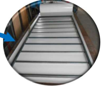
Láminas de P.R.F.V pegadas al FENOLICO u O.S.B (interior) reforzadas con estructuras